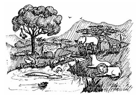
© 2010, World Missionary Press, Inc. Selected scriptures taken from The Hiligaynon Bible (Ang Pulong Sang Dios) Copyright © 1996 by Biblica, Inc.®. Used by Permission of Biblica, Inc. ® All rights reserved worldwide.